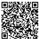
村里街路門牌查詢網站