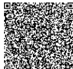
桃園市中壢區公所網站查詢學區

Q3:如果收到入學通知單，才發現不是自己中意的學區學校，是否可以去中意的學校報到，不理會本通知單？